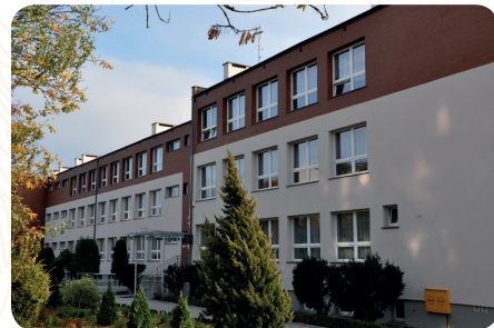
Szkoła Podstawowa Nr 2, ul. Tysiąclecia 5, Pruszcz Gdański