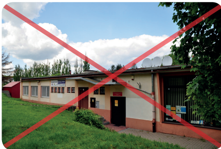
Pedagogiczna Biblioteka Wojewódzka, ul. Obrońców Pokoju, Pruszcz Gdański

Obwód głosowania Nr 3 dotyczy mieszkańców ulic: 24 Marca, Ignacego Mościckiego, Jędrzeja Śniadeckiego, Karola Olszewskiego, Obrońców Pokoju, Prof. Mariana Raciborskiego, Wojska Polskiego, od ul. Raciborskiego do ul. Obrońców Wybrzeża, Zygmunta Wróblewskiego oraz Placu Jana Pawła II.