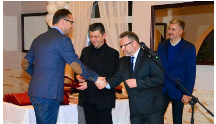
Uroczysta gala z okazji jubileuszu

Drużynie MKS Czarni Pruszcz życzymy dalszego rozwoju i sukcesów.