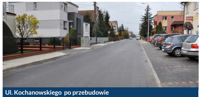
Ul. Kochanowskiego po przebudowie