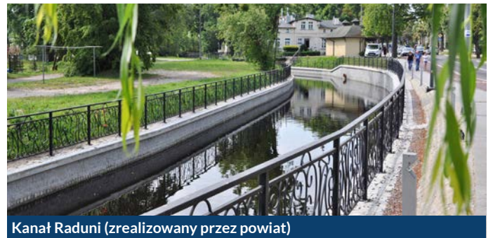
Kanał Raduni (zrealizowany przez powiat)

Inwestycje zrealizowane przez miasto Pruszcz Gdański