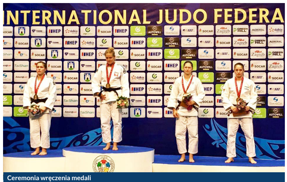
Ceremonia wręczenia medali

- Tak, ale nie za wszelką cenę. Sport to taka dziedzina życia, w której trzeba mocno uważać, żeby się nie przeliczyć. Wielu moich przyjaciół i znajomych sportowców ze względu na wydarzenia losowe musiało przerwać karierę. Ja mam nadzieję, że z jeszcze lepszą formą niż obecnie, za cztery lata zakwalifikuję się na kolejne Igrzyska Olimpijskie. To jest mój cel.