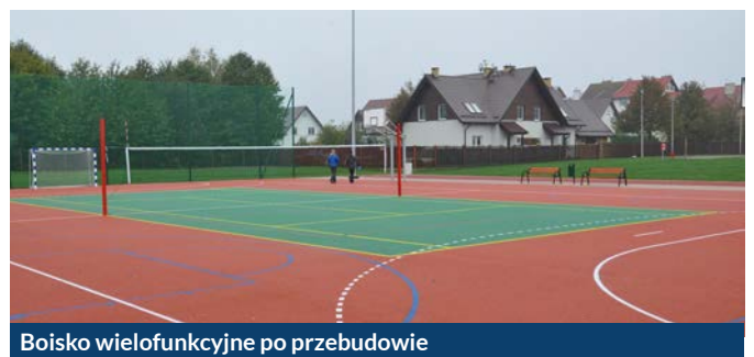
Boisko wielofunkcyjne po przebudowie