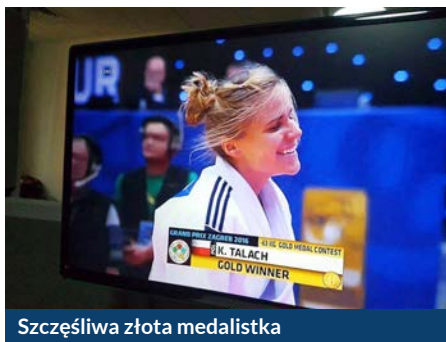
Szczęśliwa złota medalistka

- Judo to w mojej rodzinie sport pokoleniowy i rodzinny. Mój tata trenował judo. Dziś jest świetnym i poważnym trenerem. Mam w nim ogromne wsparcie, za co serdecznie dziękuję. Judo uprawia brat i trenowała siostra. Nie był to jednak przymus. Bardzo mi imponował brat