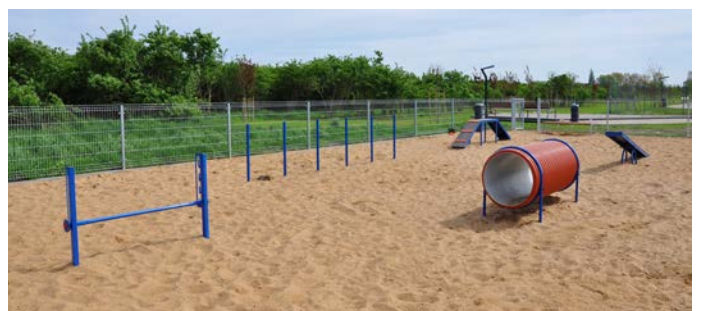
Park dla psów