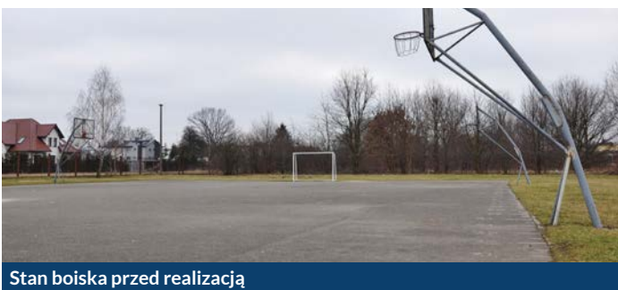
Stan boiska przed realizacją