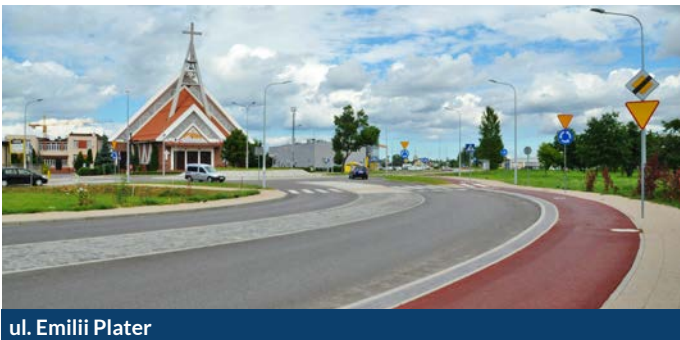
ul. Emilii Plater