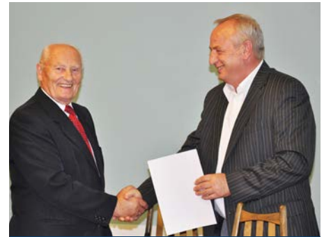
Wybór Przewodniczącego Rady Seniorów

Rada wybrała w jawnym głosowaniu Przewodniczącą Rady, którym