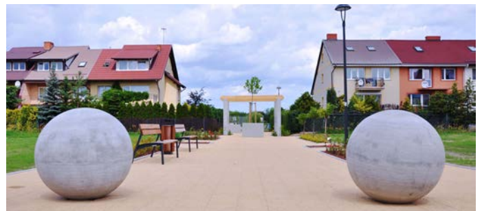
Ciąg pieszy przy ul. PCK