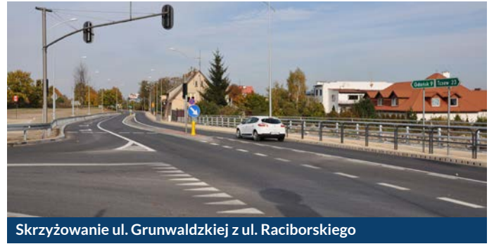
Skrzyżowanie ul. Grunwaldzkiej z ul. Raciborskiego

Inwestycje zrealizowane wspólnie ze Starostwem Powiatowym