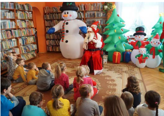
Mikołajki w bibliotece