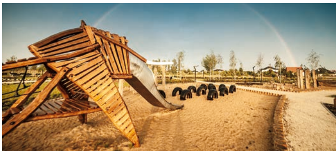
Park Krainy Polodowcowej