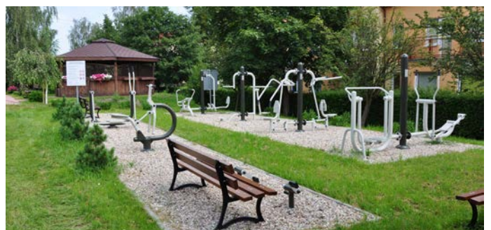
Fitness Park przy MOPS