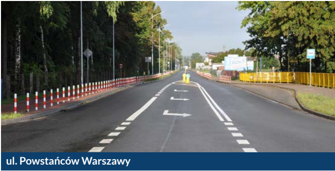
ul. Powstańców Warszawy

Inwestycje zrealizowane wspólnie z Zarządem Dróg Wojewódzkich i Generalną Dyrekcją Dróg Krajowych i Autostrad