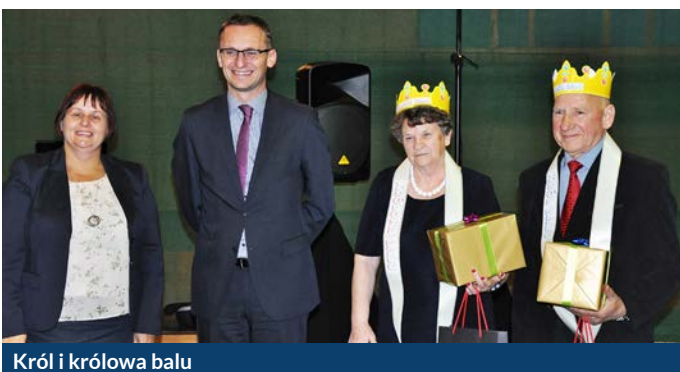
Król i królowa balu

Frekwencja na balu z roku na rok jest coraz większa. W zeszłym roku hala sportowa Zespołu Szkół Ogólnokształcących nr 1 zgromadziła około 200 gości, w tym roku było ich prawie 300.