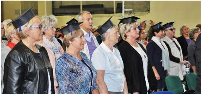
Ślubowanie nowych studentów