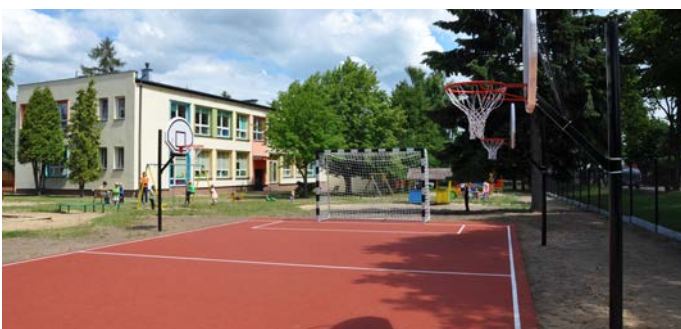
Boisko przy Przedszkolu im. Kubusia Puchatka