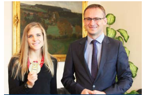
Spotkanie z Burmistrzem

- Tak, chociaż czasami było to trudne do pogodzenia. Kiedy na przykład wracałam z zawodów ze złamaną ręką, a następnie miałam egzamin gry na fortepianie to przeżywałam chwile zwątpienia. Mimo wszystko udało mi się skończyć I stopień szkoły muzycznej i z perspektywy czasu widzę tego duże plusy. Największym z nich jest to, że szkoła muzyczna uczy radzenia sobie ze stresem. Panowanie nad nim przydaje mi się podczas zawodów. Poza tym – muzyka