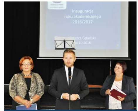
Uroczysta inauguracja nowego roku akademickiego 2016 / 2017

Studentem Uniwersytetu Trzeciego Wieku może zostać każda osoba dorosła, która pragnie poszerzać własne umiejętności i wiedzę. Słuchacze uczestniczą w zajęciach ABC komputera i fotografii