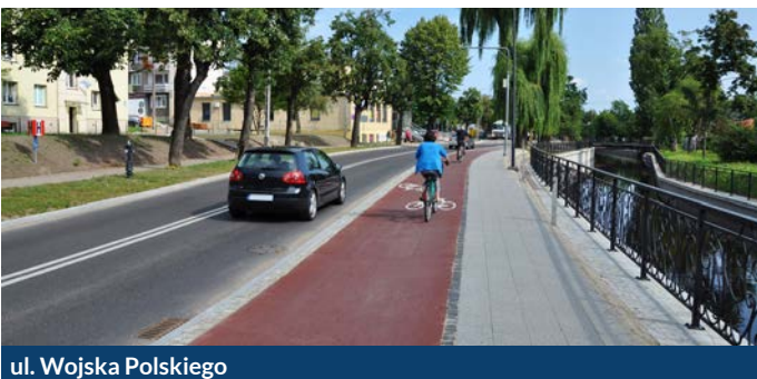
ul. Wojska Polskiego

Inwestycje zrealizowane przez miasto Pruszcz Gdański