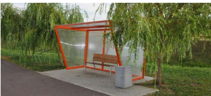
Wiata do odpoczynku