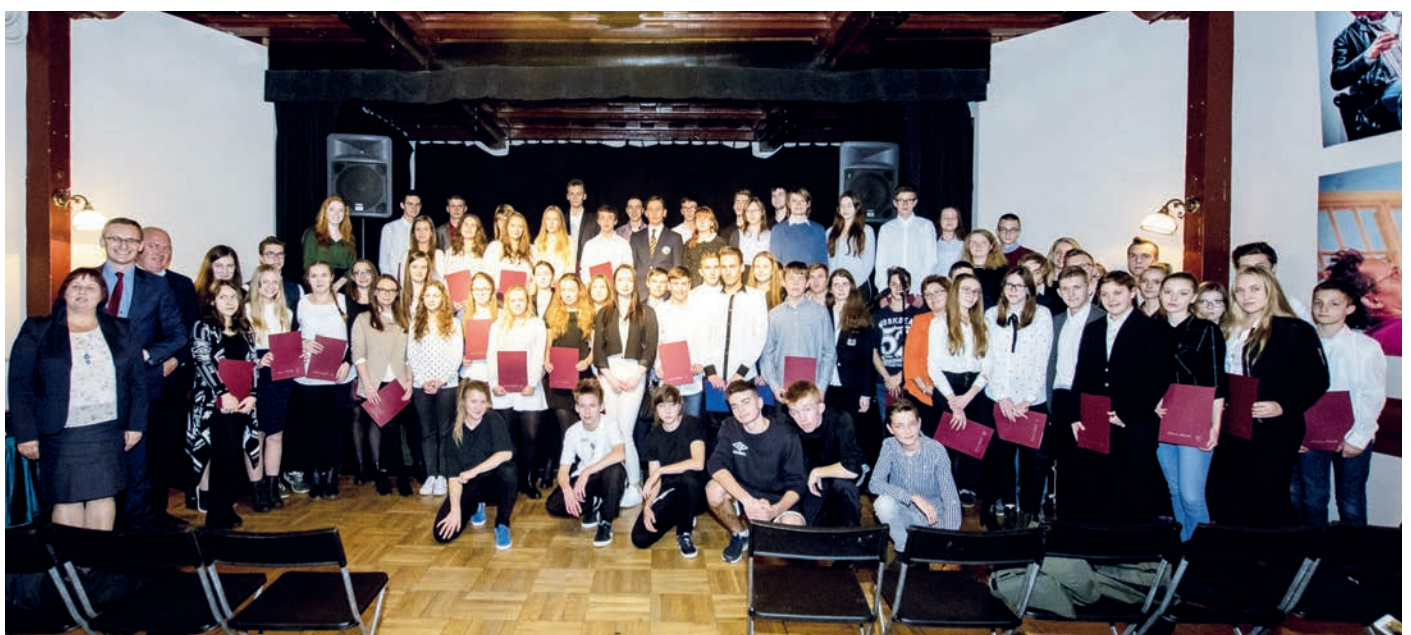
Uroczyste wręczenie stypendiów Burmistrza Pruszcza Gdańskiego

Wszystkim uczniom jeszcze raz serdecznie gratulujemy i życzymy dalszych sukcesów w nauce oraz wybitnych osiągnięć w sporcie.