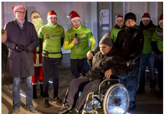
Zabawa mikołajkowa pod urzędem