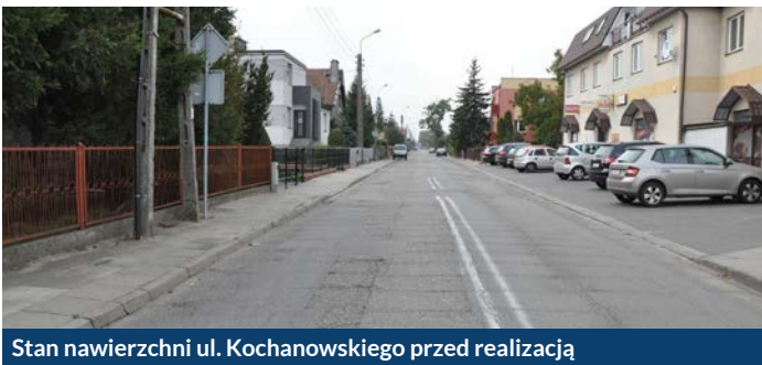
Stan nawierzchni ul. Kochanowskiego przed realizacją

Prace polegały w szczególności na rozbiórce istniejącej nawierzchni asfaltowej oraz budowie nowego boiska wielofunkcyjnego z nowoczesną nawierzchnią, a także budowie bieżni prostej o długości 80 mb, chodników i opasek, oświetlenia, piłkochwytyw. Zadbano o przyległy teren zielony oraz wyposażono obiekt.