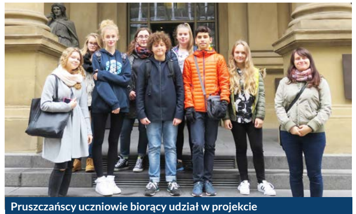
Pruszczańscy uczniowie biorący udział w projekcie