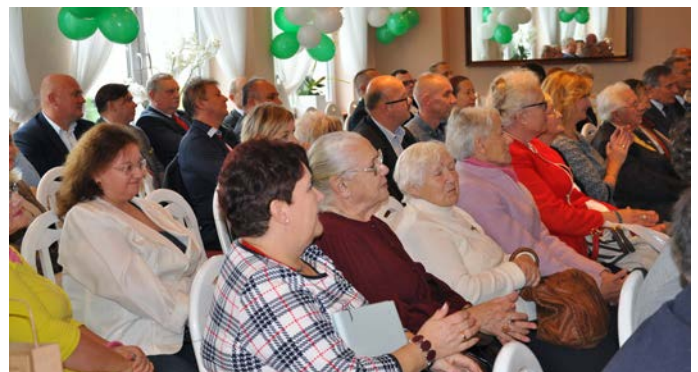
Goście zaproszeni na jubileusz