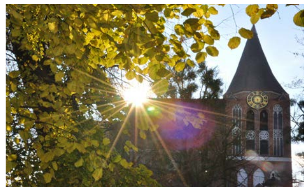
Wieża kościoła z odtworzonymi maswerkami

w ostatnim czasie przez Urząd Miasta. Już niedługo czeka nas kolejna. Miasto ogłosi jeszcze w tym roku przetarg na remont dworku przy ulicy Krótkiej 6.