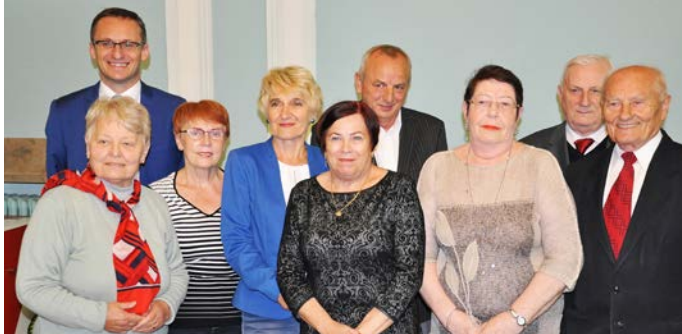
Pierwsza sesja Rady Seniora

W Urzędzie Miasta Pruszcz Gdański odbyło się pierwsze posiedzenie Rady Seniora Miasta Pruszcz Gdański.