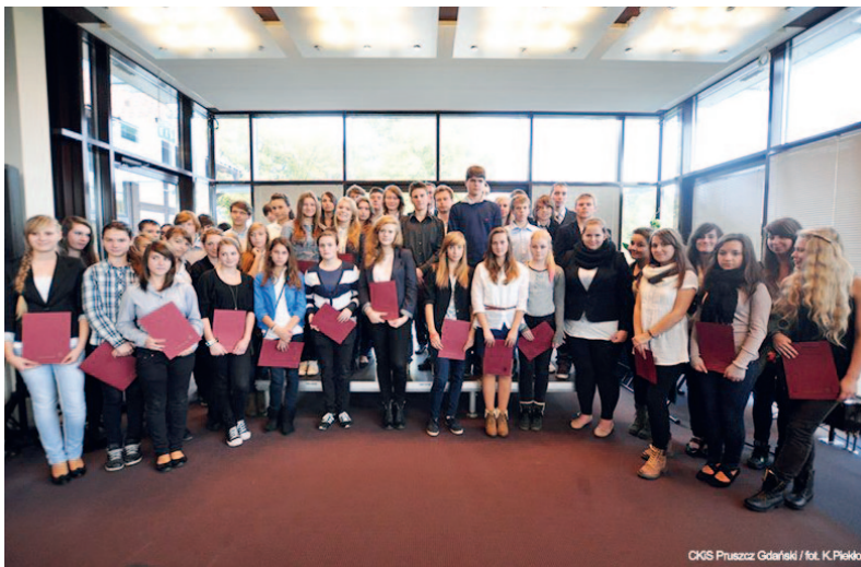
Pamiątkowe zdjęcie tegorocznych stypendystów

Wszystkim uczniom jeszcze raz serdecznie gratulujemy i życzymy dalszych sukcesów w nauce oraz wybitnych osiągnięć w sporcie.